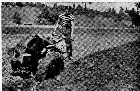
Typen 1944: 4, 8 und 10 PS.