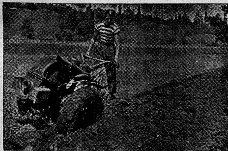
Typen 1945: 4, 8 und 10 PS.

FR. SAUTER/A.G., Fabrik elektr. Apparate, BASEL