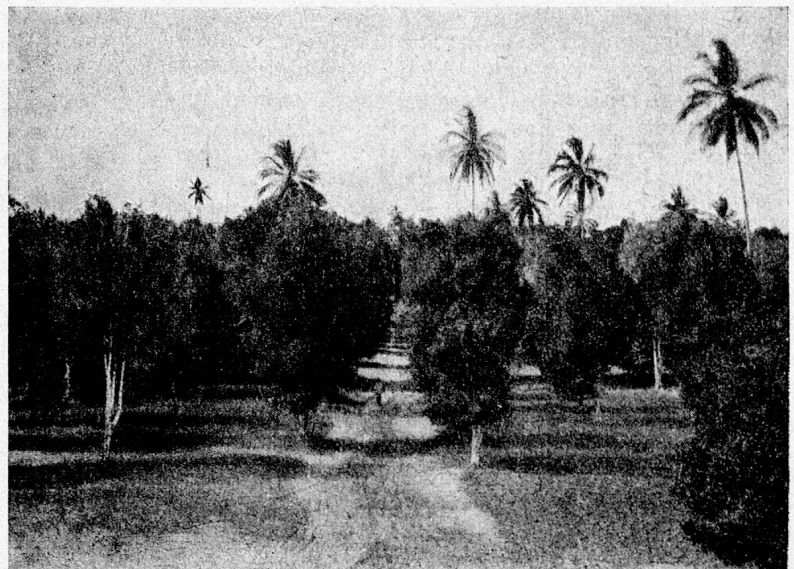
Gewürznelkenpflanzung auf Sansibar