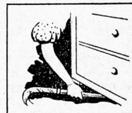
Einige der vielen Verwendungsmöglichkeiten der Zubehörteile