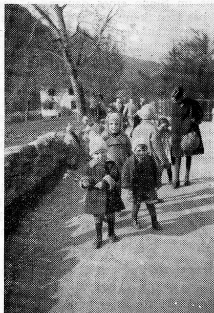
Auf dem Spaziergang

Expertenkommission vorgelegt. Diese anerkannte die Notwendigkeit eines Ausbaues und die mit der geplanten Erweiterung verbundenen Schwierigkeiten. Sie befürwortete die Schaffung eines abgesonderten Baues für die Kleinkinder-Abteilung. Die Wahl des Architekten fiel auf G. Brunold sen., Arosa, der dort bereits eine ähnliche Aufgabe, den Bau des Kinderhauses der Bündner Heilstätte, mit Erfolg gelöst hatte. Ein Ausbau konnte aber nur in Frage kommen, wenn sich ausserkantonale Nutzniesser gegen Einräumung besonderer Ansprüche zu einer finanziellen Beteiligung bereiterklärten. Nach gründlicher Abklärung aller Fragen erklärte sich die Stadt Zürich