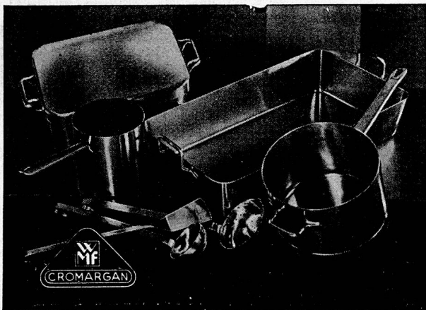
Kochgeschirre, Küchen- und Tafelgeräte aus Chrom-nickelstahl für Anstalten und Spitäler liefert als Spezialität seit vielen Jahren die Firma