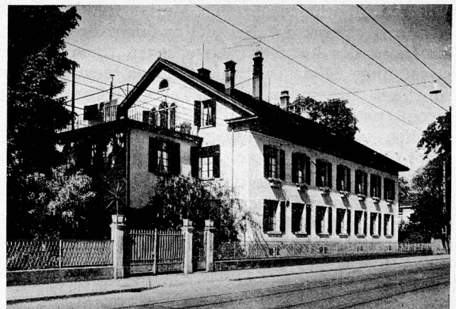
Das alte Waisenhaus in Winterthur

Im Jahre 1935 wurde von den Behörden der Vorschlag gebracht, das Waisenhaus aufzuheben.