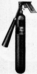
Abb. 3 Primus Typ CO 2 /3 P

vorwiegend bei Bränden der Klasse 2 der Fall sein, z. B. in Küchen, wo heisses Fett oder Oel sich entzünden kann. Hier wird es ratsam sein, ein anderes Löschmittel zu verwenden als Luftschaum, der mit