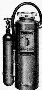
Abb. 1. PRIMUS-Luftschaum-Hand-Feuerlöschapparat Typ LS 12 für Entstehungsbrände. PRIMUS LS 12

Das Löschmittel Luftschaum eignet sich auf Grund seiner Eigenschaften gleichermassen gut zur Löschung fester und flüssiger wie auch gemischter Brennstoffe. Es ist unschädlich und ungiftig, verursacht weder Wasserschäden noch Korrosionen und hinterlässt keine