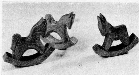
Rösschen — Eselchen

Abgesehen von einer kurzen Anfangsperiode ist es mir bisher noch nicht gelungen mit Zöglingen zu