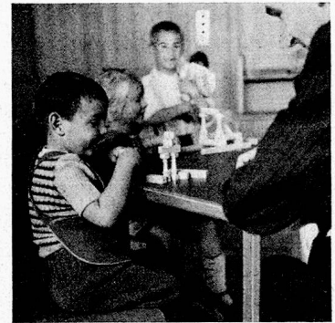
Die Hausarbeiten werden von den Kindern in einem bestimmten Turnus besorgt.

station an eine Heil- und Pflegeanstalt einhergehen. So wurden ohnehin überempfindliche und womöglich geschädigte Kinder nach der Entlassung aus der Beobachtungsstation mit dem Vorwurf belastet, sie seien in einer Heil- und Pflegeanstalt gewesen. Aus diesem Grunde ging als nächster der Kanton Solothurn seine eigenen Wege und eröffnete seine Beobachtungsstation nicht in unmittelbarer Nähe der Heil- und Pflegeanstalt Rosegg, sondern in Biberist, das eine gute Wegstunde davon entfernt liegt.