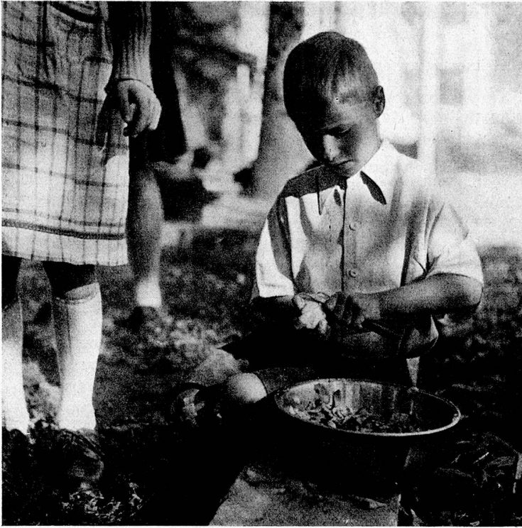
Zu allen Hausarbeiten werden Kinder herangezogen. Jedes hat sein Aemtchen zu verrichten.