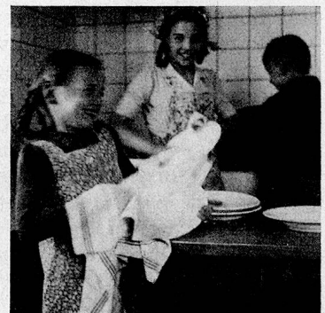
Fröhliche Kinder bei allerhand gemeinsamer Tätigkeit.