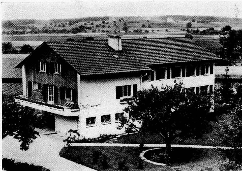
Lehrlingspavillon des Landheims Brüttisellen

Der Präsident des Mädchenheims Schloss Köniz BE weist darauf hin, dass scheinbar unwertes Leben nicht nur dadurch Sinn und Inhalt bekommt, dass es gelingt, eine geistesschwache Tochter soweit auszubilden, bis sie sich selber durchbringt, sondern vor allem auch dadurch, dass alle, die mit diesem Menschen umgehen, gebildet werden. «Nur dieses geistesschwache Mädchen kann in seinen Mitmenschen die tiefste Geduld zur Reife bringen, eine Geduld, die sonst gar nicht reifen würde.» Der Hausvater vergleicht seine Zöglinge von heute mit jenen vor 20 und 30 Jahren. Anstelle der Kinder vom Land sind vorwiegend solche aus der Stadt getreten. Sie unterscheiden sich nicht nur äusserlich, in Kleidung und Aussehen, voneinander, verwaahlteste Stadtjugend ist auch innerlich ganz anders. Die Erziehungsaufgabe ist nicht kleiner geworden. Sie erfordert von allen Mitarbeitern besondere Qualitäten und grosse Hingabefähigkeit. Dafür wird ihnen auch herzlich gedankt.