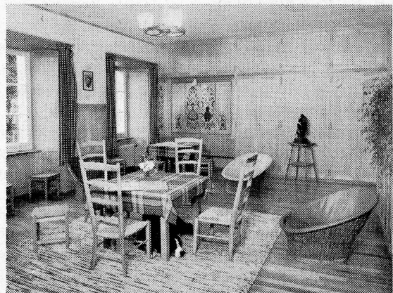
Der gediegene Aufenthaltsraum strahlt eine wohnliche und gemütliche Atmosphäre aus