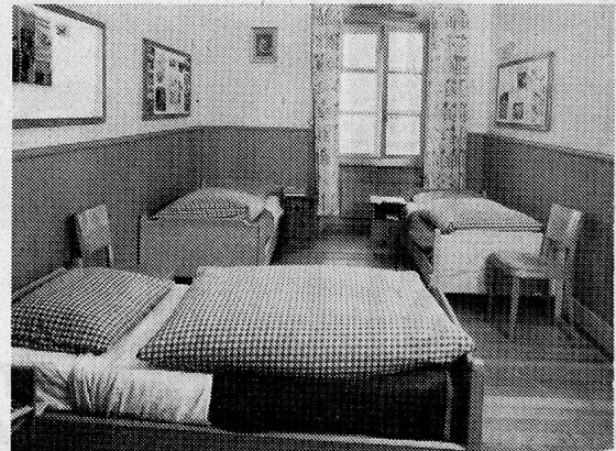
Im Hauptgebäude wurden allzugrosse Schlafsäle in gemütliche Zimmer unterteilt