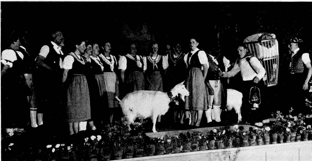
Aus den Darbietungen am Appenzeller Abend im Casino Herisau