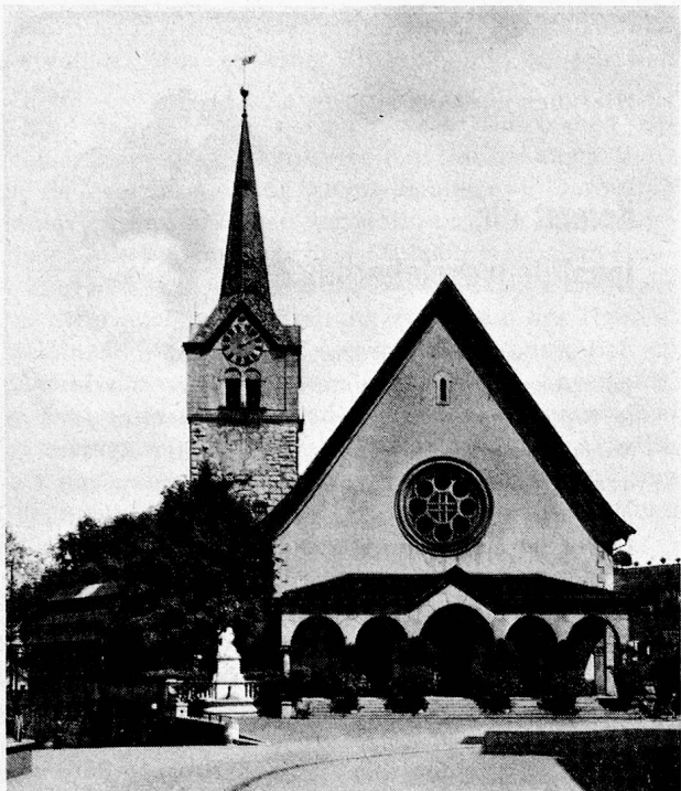
Die reformierte Kirche in Herisau

weiten Kreisen diese Unterstützung fast nicht mehr möglich wurde. Diese Art Doppelbesteuerung wird nun gemildert. Das ist richtig. Der Bürger, der ein ihm bekanntes und von ihm gefördertes gemeinnütziges Werk unterstützt, soll nicht noch für diese von ihm aufgewendeten Summen besteuert werden.