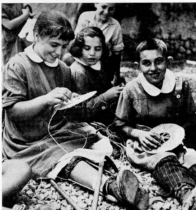
Die freundliche Atmosphäre ihrer Schule spiegelt sich auf den Gesichtern dieser griechischen Kinder

Die Kinder hatten in Reihen Aufstellung genommen, nicht alle, — einige, vor allem die meisten Geisteschwachen, aber auch einzelne der körperlich Behinderten, die offenbar nicht den nötigen Grad der Musikalität besaßen, bildeten die Zuhörerschaft. Doch auch sie fühlten sich als vollständig dazugehörig, nicht etwa als minderen Ranges — man merkte es ihrem Eifer und ihrer Anstrengung des Mitgehens an, dass sie die Sache als ihre ureigene, als Angelegenheit der ganzen kleinen Gemeinschaft betrachteten, zu der sich jeder einzelne mit Stolz zuzurechnen schien. Uebereinstimmung herrschte, völlige Eintracht zwischen den Stärkeren und Schwächeren, gegenseitiges Sich-Stützen, keine Ahnung von Neid. Im Haus war keines der Kinder zurückgeblieben, offensichtlich waren nun alle, etwa vierzig bis fünf-