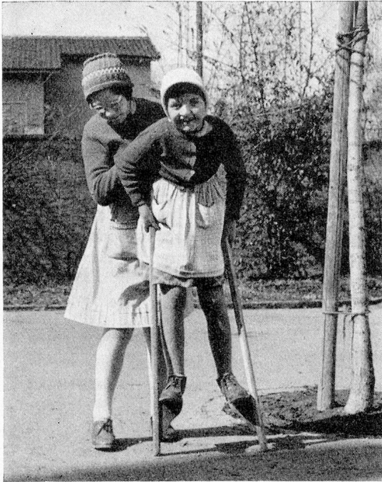
Eines hilft dem andern