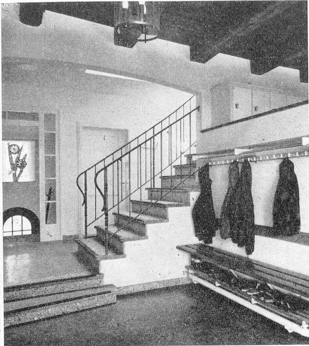
Eingangshalle mit Garderobe