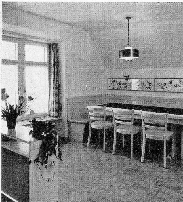
Wohn- und Spielzimmer der Knaben