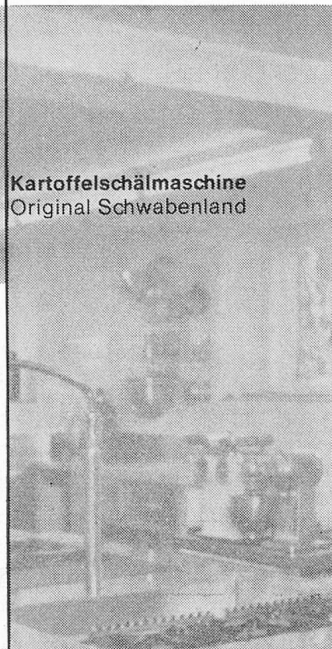
Kartoffelschälmaschine Original Schwabenland