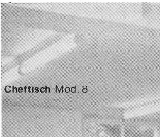
Cheftisch Mod. 8

Wir übernehmen die Planung und Ausführung kompletter Küchen- und Kantinen- Einrichtungen.