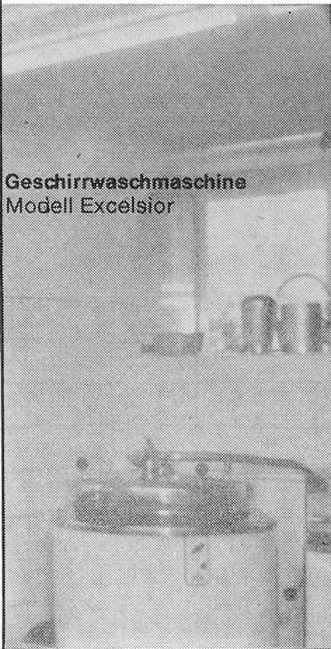
Geschirrwashmaschine Modell Excelsior