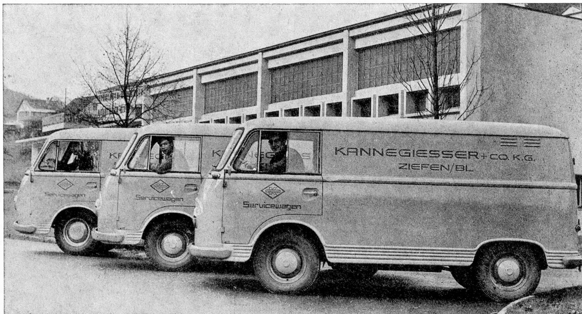
Kannegiesser-Servicewagen vor unserem Werk in Ziefen BL

Es genügt heute nicht, gute Maschinen zu bauen. Auch die zuverlässigste Maschine versagt einmal ihren Dienst. Wichtig ist, sie schnell wieder einsatzfähig zu machen. Dafür sorgt unser gut ausgebauter Kundendienst. Jeder Servicewagen hat für gut 20 000 Franken Ersatzteile an Bord. Unsere Servicemonteuere wurden monatelang an unseren Maschinen ausgebildet.