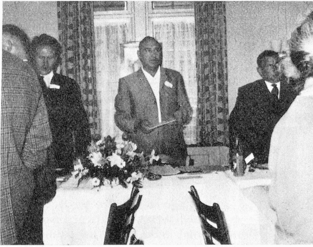
Eröffnungslied — auch am Vorstandstisch wird kräftig gesungen