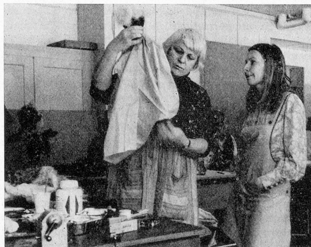
Meister und Schüler im Bann des Kaspars