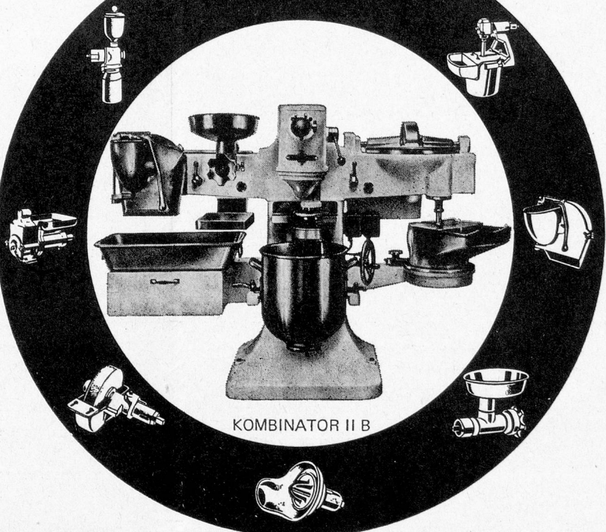
KOMBINATOR II B