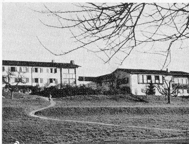
1951 entstand das gemeindeeigene Kinderheim «Sonnhalde», das in den nächsten Jahren erweitert werden dürfte.

Vor rund 120 Jahren erwarb die Gemeinde das ehemalige Bad «Rothen» in der Gemeinde Littau mit Wirtschaft und Landwirtschaftsbetrieb zum Preise von 28 831 Franken und richtete hier das Bürgerheim ein. Durch verschiedene Renovationen wurde dieses im Verlaufe der Jahrzehnte zu einem den heutigen Verhältnissen angepassten wohnlichen Heim umgestaltet. Im Frühling 1963 durften Betagte und Pflegebedürftige