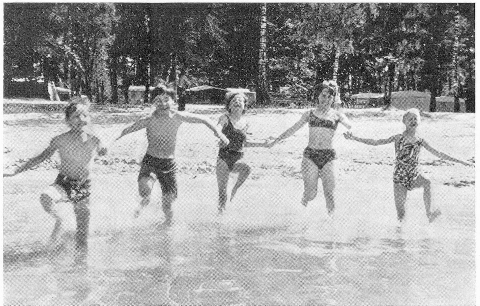
Spiel im Wasser

sen, mit grosser Wahrscheinlichkeit als Folge der Blindheit und des dadurch bedingten Entwicklungsrückstandes und der eingeengten Kontaktmöglichkeit mit der Umwelt erklärt werden. Der Bewegungsdrang, eingesperrt in die Enge des Tastraumes, entlädt sich in einer ungeordneten Weise. Diese Auffälligkeiten, welche wir also nicht als Folge von Schäden im zentralen Nervensystem betrachten dürfen, kann der Pädagoge kaum bekämpfen. Er muss versuchen — je früher damit begonnen wird, um so sichtbarer der Erfolg —, die Vorstellungswelt zu bereichern und dem Sehbehinderten durch Musik, Eurhythmie und Tanzspiele, allenfalls attraktive Jazzrhythmen unbemerkt motorische Sicherheit zu geben.