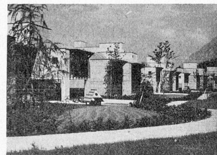
Die Kinder-Wohnhäuser des Sonderschulheims Rütimattli, dahinter der Schul- und Gemeinschaftstrakt.

Privatinitiative stand am Anfang der Entwicklung des Sonderschulwesens im kleinen, rund 25 000 Einwohner zählenden Kanton Obwalden: Vor etwa einem Jahrzehnt wurde die Gloria-Stiftung gegründet, und der Gründer, Gottlieb Gloor , widmete ihr das Kinderheim Schoried in Alpnach, in welchem eine heilpädagogische Tagesschule eingerichtet wurde. Im Jahr 1972 kam das Arbeitszentrum Sarnen als Anlehr- und Dauerwerkstätte für Behinderte hinzu, und schon ein Jahr später wurde im Schulheim Sommerau in Stalden-Sarnen der Internatsbetrieb eröffnet. Mit dem Schulheim Rütimattli für geistig- und mehrfachbehinderte Kinder im Alter von 5 bis 18 Jahren, das seit August letzten Jahres in Betrieb steht und am 17. Juni 1977 eingeweiht wurde, ist ein weiterer wichtiger Schritt getan. Zu