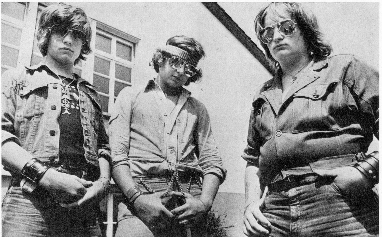
Diese drei Hobby-Rocker, Hauptwidersacher des «Scharli», wandeln sich im Film in globo vom Saulus zum Paulus.