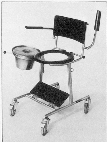
Klosettrollstuhl Mod. 49, Fussbrett, WC-Brille und Topfhalter wegnehmbar. Kann über Klosomat gefahren werden.