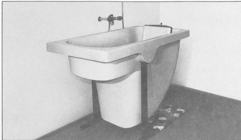
BILL-Wanne, aus glasfaserverstärktem Polyesterharz, für einfaches und problemloses Baden von Behinderten und Betagten.