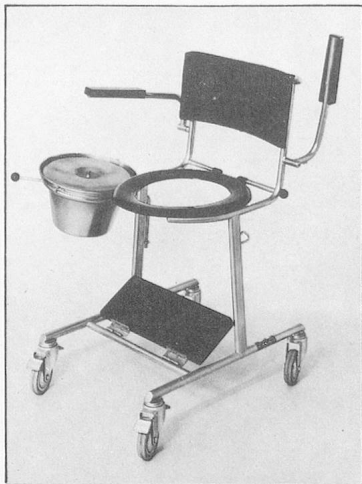
Klosettrollstuhl Mod. 49, Fussbrett, WC-Brille und Topfhalter wegnehmbar. Kann über Klosomat gefahren werden.