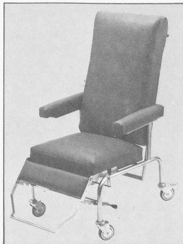
Patientenfauteuil A/0176 S, Armlehnen aufklappbar, Verstellautomatik, Kunstlederbezug, verchromt mit 100 mm Lenkrollen, Fussraster fünffach verstellbar.