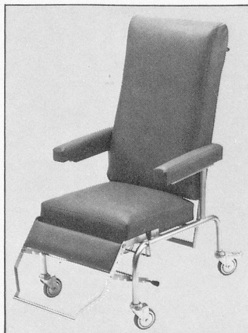
Patientenfauteuil A/0176 S, Armlehnen aufklappbar, Verstellautomatik, Kunstlederbezug, verchromt mit 100 mm Lenkrollen, Fussraster fünfmal verstellbar.