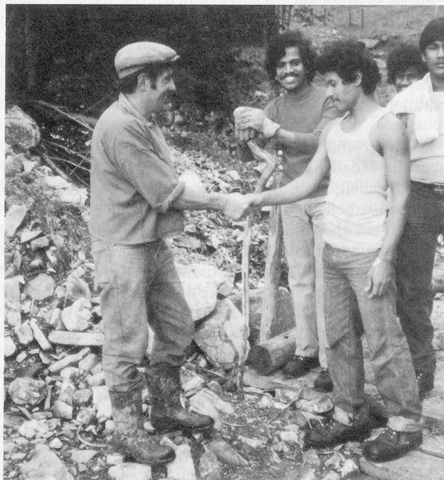
Der Dank nach getaner Arbeit: «Allein hätten wir es nie geschafft!»

Gegen den negativen Entscheid ist ein Rekurs möglich, die Erfolgsaussichten sind aber gering. Wenn man keine neuen Fakten und Belege beibringen kann, hat man kaum Chancen. Ist auch dieser Entscheid negativ, bleiben nur noch einige winzige Hintertüren , um nicht ausgewiesen zu werden: Internierung oder Verzicht auf Ausweisung aus humanitären Gründen zum Beispiel. Ansonsten aber heisst es unbarmherzig: Verlassen Sie die Schweiz, oder Sie werden in Ihr Heimatland zurückgeschafft. Eine solche