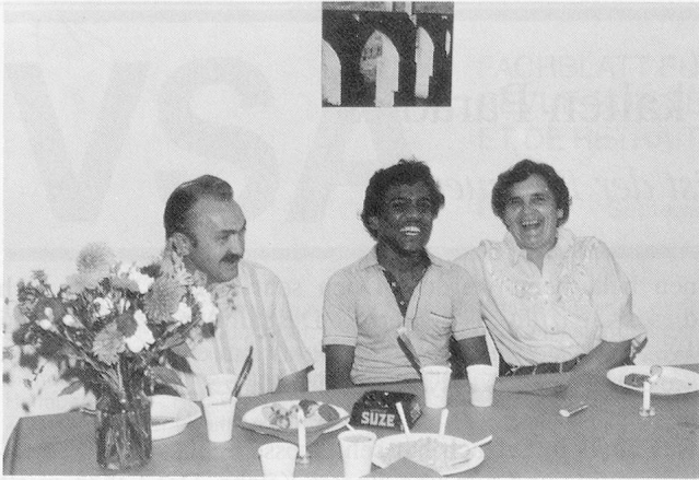
Tag der offenen Tür in Bettlach: Wenn das Eis erst einmal gebrochen ist, kommt man sich schnell näher . . .

Bewohner des Hauses unsere Lebensweise, unsere Kultur und die Gegebenheiten so weit begreifen soll, dass er später in der harten, «kalten» schweizerischen Realität bestehen kann. Er muss beispielsweise wissen, wie, wo und für wieviel Geld er einkaufen soll und wie er das Ganze dann zu einer schmackhaften Mahlzeit verwertet – auch wenn er zu Hause nie selbst gekocht hat, weil das «Frauensache» war. Auch etwas so Banales wie das Putzen kann zu einem grossen Problem – und zwar aus praktischen wie soziokulturellen Gründen – werden.