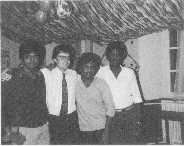
Der Berichterstatter (Zweiter von links) nimmt Abschied vom Durchgangszentrum: Hemd, Krawatte und Socken (nicht im Bild) sind die Geschenke der tamilischen Zentrumsbewohner.

Jungen nur schon gemeinsam ins Kino gehen. Alkohol ist für junge Männer tabu. Bis etwa 25 Jahre stehen sie unter der überaus strengen Aufsicht des Vaters.