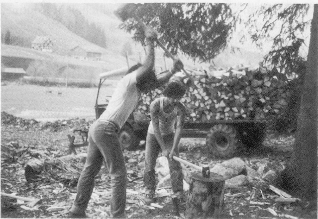
Obwohl diese Asylbewerber offiziell noch nicht arbeiten dürfen, gibt es doch immer wieder Gelegenheiten, das kärglich bemessene Sackgeld (Fr. 4.– pro Tag) etwas aufzubessern.

Dies alles macht die Schule zu einem lebendigen, aufgestellten Begegnungsort, zu einer ganz wichtigen Struktur des Zentrums. Obwohl der Schulunterricht freiwillig ist