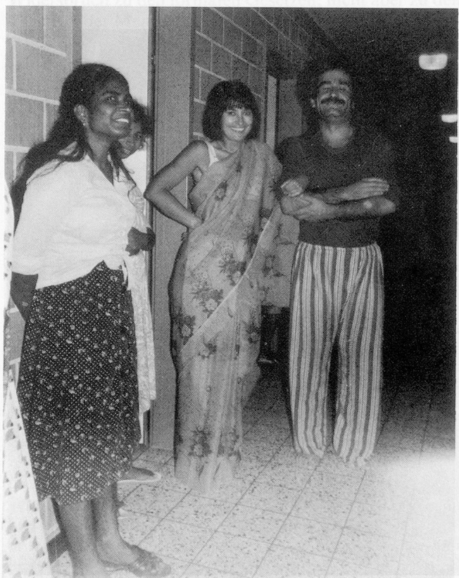
Nur die schöne Polin, eingekleidet von den beiden Tamilinnen, hat es geschafft, den berühmten türkischen Dauerschläfer aus den Federn zu holen. Er ist allerdings noch im Pyjama...

Überwindet der Asylbewerber diese erste Hürde erfolgreich, dann beginnt das grosse Warten: Beim Eidgenössischen Polizei- und Justizdepartement sind momentan rund 26 000 Gesuche hängig. Deshalb kann es fünf Monate (wenn das Gesuch vorrangig behandelt wird), aber auch fünf Jahre dauern, bis der Asylbewerber das Aufgebot von Bern zur zweiten Befragung erhält. Diese zweite Befragung