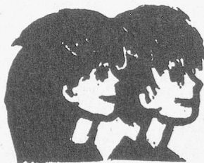
Beobachtungsstation Sonderschulheim Aussenwohngruppe

Schriftliche Bewerbungen sind zu richten an: Alterswohnenzentrum «Gässliacker», Mühleweg 2, 5415 Nussbaumen.