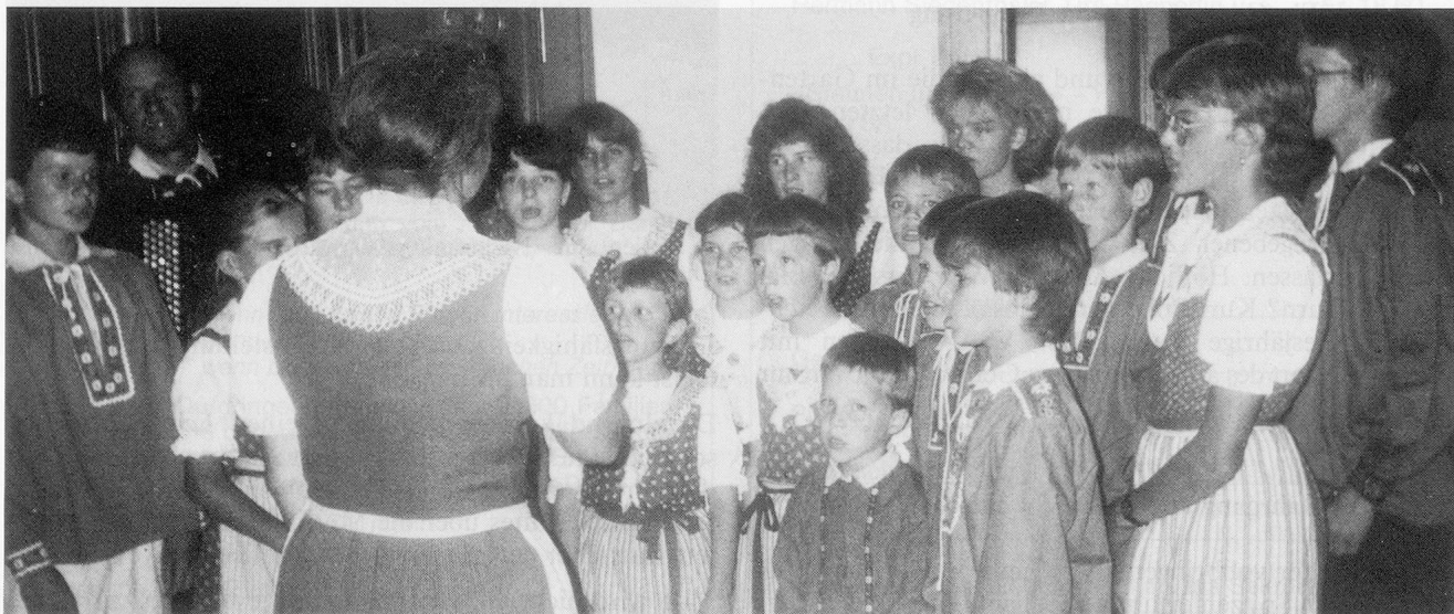
Den Kindern und den Leitern des Hinterberger-Chörlis aus Flawil gegenüber wurde mit Beifall nicht gespart.