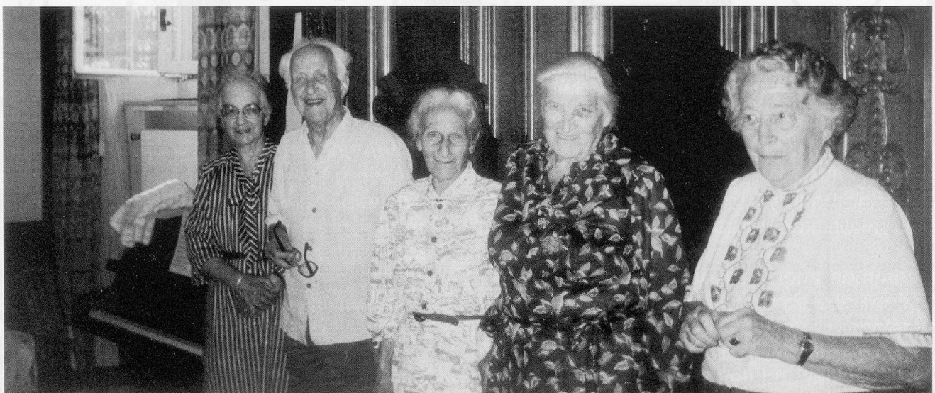
Ehrungen von Veteranen gab es auch diesmal: Gruppenbild – vier Damen und ein Mann.

Überleben zu kämpfen. Ein Honiglecken war ihr Einsatz nicht. Ihr Urteil über die nachfolgende jüngere Generation ist denn auch zweideutig. Man anerkennt zwar durchaus, dass die Verhältnisse anders und komplizierter geworden seien, aber viele sind auch der Ansicht, einerseits wollten die Jungen immer gern das Pulver erfinden und seien andererseits zugleich mit dem Ruf konfrontiert, nicht sehr belastbar und ein bisschen wehleidig zu sein. Wie und was auch immer – die Veteranen haben gelernt, sich zu freuen und für alles Schöne ihrer Lebensphase von Herzen dankbar zu sein. Deshalb wurde in St. Gallen zum Anfang vielstimmig das Lied «All Morgen ist ganz frisch und neu» gesungen.