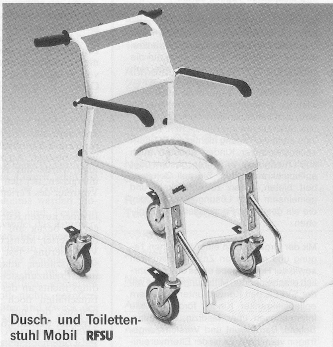
Dusch- und Toilettenstuhl Mobil RFSU

Haco AG, 3073 Gümligen, Tel. 031/52 00 61