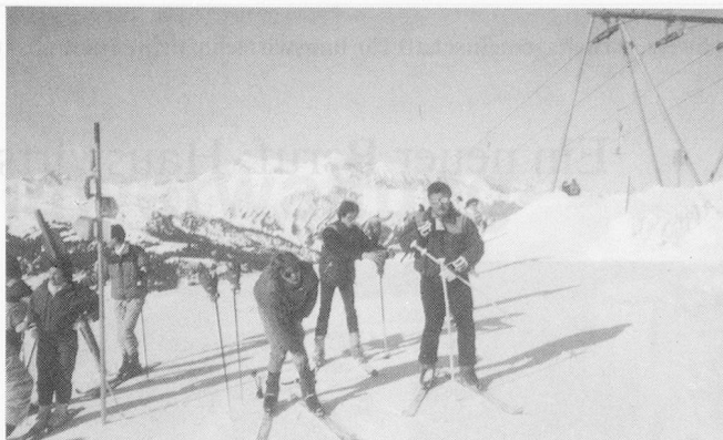
Freizeit: Plausch im Skilager

Der St. Gallerkurs 1989 möchte sich nach einer theoretischen Einführung durch Referate mit dieser Thematik auseinandersetzen. In der Gruppenarbeit sollen vermehrt praktische Fragen erörtert werden, die zu besserem Verständnis von «Machbarem» oder eben nicht «Machbarem» führen.