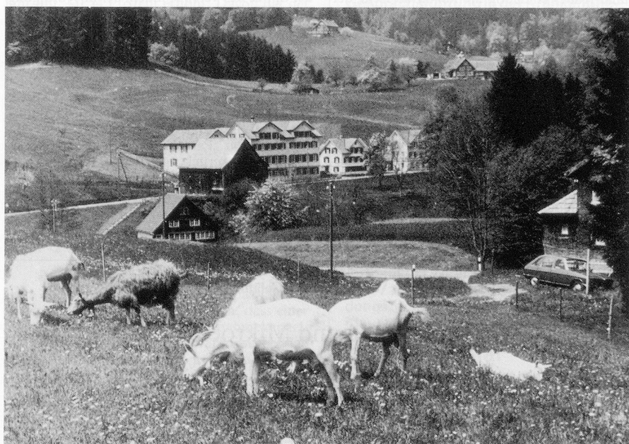
Nach einigen Jahren der Flaute ist heute die Zukunft des Ferienheims Schönenbühl im appenzellischen Wolfhalden gesichert. Heute wird Aufhalten im schmucken Doppelgiebelhaus (Mitte) wieder grosse Bedeutung beigemessen, zumal unzählige Begegnungen mit der Natur möglich sind.

aus ärmlichen Verhältnissen Ferien zu ermöglichen. Nachdem auch in der damaligen Gemeinde Töss mit Erfolg an die Wohltätigkeit und Gemeinnützigkeit appelliert worden war, konnte der neu ins Leben gerufene Ferienkolonieverein 1889 im Gasthaus «Wilhelm Tell» in Bauma eine erste Kolonie verwirklichen. 1896 wurden im «Landhaus» in Wattwil neue Unterkünfte gefunden. Nachdem aber auch hier keine dauerhafte Lösung möglich war, erhielt die Kommission den Auftrag, im Appenzellerland nach einem geeigneten Gebäude Ausschau zu halten.