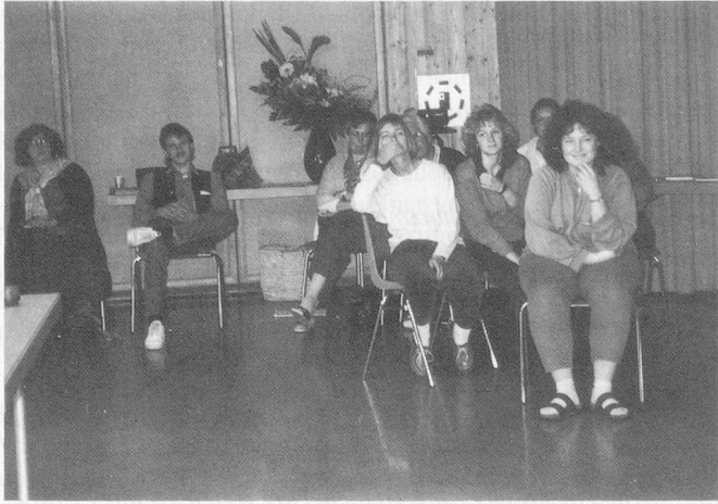
Warten . . . und die Wartenden schmunzelten dazu.

Alten Testament des öftern anzutreffen sei. Sie zitierte Thomas von Aquin : Die Schau der Weisheit könne deshalb mit dem Spiel verglichen werden, weil beides tiefe Freude berge und weil das spielende Tun nicht auf ein anderes hin ziele, sondern um seiner selbst willen gesucht werde, was auch für die Freuden der Weisheit zutreffe.