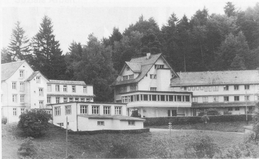
Gesamtansicht des leicht oberhalb Walzenhausens gelegenen Ferien- und Kurszentrums Sonneblick. Rechts im Bild der 1944/45 erstellte Neubau, der nun einen behindertengerechten Ausbau erfahren hat.

Eine erfreuliche Entwicklung hat das 1933 in Walzenhausen eröffnete evangelische Sozialheim Sonneblick erfahren. Nach einem Umbau präsentieren sich die Gebäulichkeiten als behindertenfreundliches Ferien- und Kurszentrum, das immer wieder auch Bewohnern anderer Heime aus der ganzen Schweiz erholsame Aufenthalte im schönen Appenzellerland ermöglicht.