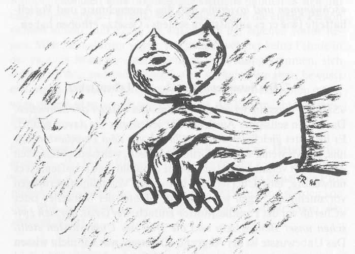
Auf seiner Hand liessen sich zwei Schmetterlinge nieder.

Der Mann war beschäftigt: Auf seiner Hand hatten sich zwei Schmetterlinge niedergelassen. Vor allem einer davon schien es ihm angetan. Seine Lippen verrieten, dass er sich mit dem flatterhaften Dauergast unterhielt. Im Gesicht des Alten brach dabei ein wehmütig zärtliches Lächeln auf, zauberte zusätzlich Falten zwischen Augen und Bartkranz. Ich musste vor allem diese Hand mit dem Schmetterling zeichnen – und sie geriet mir nicht schlecht. Da stand der Alte auf, streckte mir die Hand hin und meinte: «Dieser hier ist mir besonders treu.» Da erlosch plötzlich das Licht in seinem Gesicht, er drehte sich abrupt um und ging davon. Gerne hätte ich ihm nachgerufen: «Warten Sie doch! Blei-