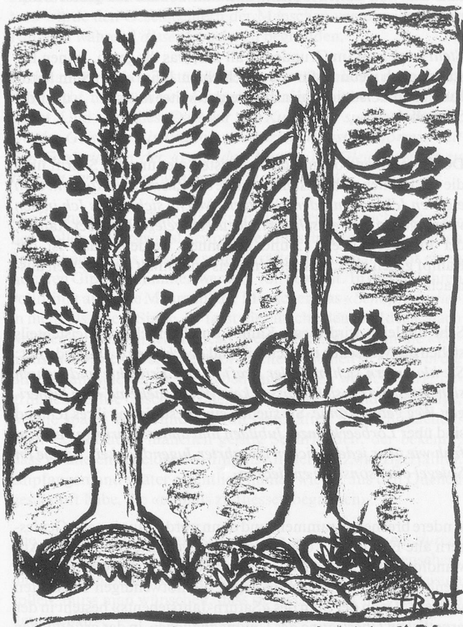
Regenwetter am Lej dals Chöds