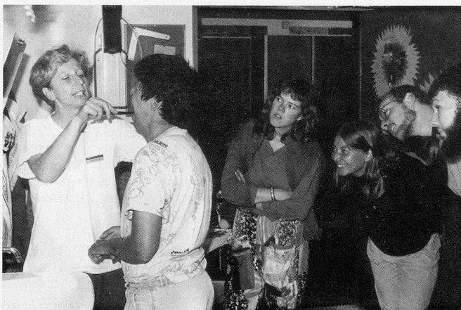
Demo II: Anweisungen für die Untersuchung der Mundhöhle und Zahnreinigung am Leicht-Behinderten.

ben der Zahnbürste, die auch nur dann etwas nützt, wenn sie richtig angewendet wird, sind Zahnseide, Zahnstocher und «Flaschenputzer» für die Zwischenräume die gängigsten Hilfsmittel. Der zweite Demo-Platz ist für die Zahnreinigung am Behinderten eingerichtet. Unter fachkundiger Anleitung können viele Behinderte ihre Zähne weitgehend selbständig pflegen, mit kleinen Tricks (wie beispielsweise dem Zahnbürstengriff, der durch einen Tennisball gesteckt ist und so mehr Halt gibt) kommt man hier