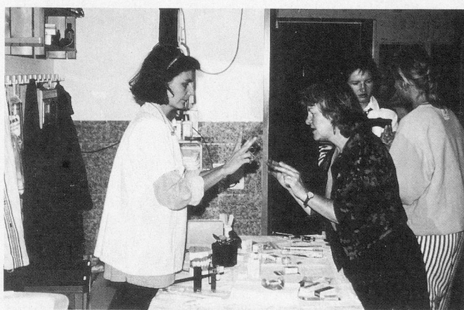
Demo I: Die persönliche Mundhygiene der Teilnehmer steht im Vordergrund. Die korrekte Anwendung von Zahnbürste und Zahnseide ist nicht einfach.

Der Kurs ist in eine theoretische und eine praktische Phase aufgeteilt. In drei intensiven Stunden werden am ersten Kurstag theoretische Kenntnisse vermittelt; die Stofffülle reicht von anatomischen Grundlagen über Mundhygienemittel bis zur Diagnose von Entzündungen, Karies, Plaque und anderen Problemen. Der zweite Kurstag bietet die Möglichkeit, dieses Wissen praktisch zu erproben: An drei Demonstrationsplätzen wird in Kleingruppen die Anwendung verschiedener Hilfsmittel ausprobiert, wobei das Demonstrationsmaterial von verschiedenen Firmen grosszügig zur Verfügung gestellt wird. Der praktische Teil des Kurses geht von der Selbsterfahrung aus: Am ersten Demo-Platz probieren die Kursteilnehmer alles zuerst einmal im eigenen Mund aus. Ne-