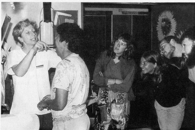
Demo II: Anweisungen für die Untersuchung der Mundhöhle und Zahnreinigung am Leicht-Behinderten.

ben der Zahnbürste, die auch nur dann etwas nützt, wenn sie richtig angewendet wird, sind Zahnseide, Zahnstocher und «Flaschenputzer» für die Zwischenräume die gängigsten Hilfsmittel. Der zweite Demo-Platz ist für die Zahnreinigung am Behinderten eingerichtet. Unter fachkundiger Anleitung können viele Behinderte ihre Zähne weitgehend selbständig pflegen, mit kleinen Tricks (wie beispielsweise dem Zahnbürstengriff, der durch einen Tennisball gesteckt ist und so mehr Halt gibt) kommt man hier