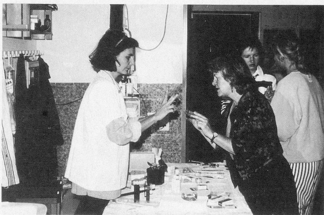
Demo I: Die persönliche Mundhygiene der Teilnehmer steht im Vordergrund. Die korrekte Anwendung von Zahnbürste und Zahnseide ist nicht einfach.

Der Kurs ist in eine theoretische und eine praktische Phase aufgeteilt. In drei intensiven Stunden werden am ersten Kurstag theoretische Kenntnisse vermittelt; die Stofffülle reicht von anatomischen Grundlagen über Mundhygienemittel bis zur Diagnose von Entzündungen, Karies, Plaque und anderen Problemen. Der zweite Kurstag bietet die Möglichkeit, dieses Wissen praktisch zu erproben: An drei Demonstrationsplätzen wird in Kleingruppen die Anwendung verschiedener Hilfsmittel ausprobiert, wobei das Demonstrationsmaterial von verschiedenen Firmen grosszügig zur Verfügung gestellt wird. Der praktische Teil des Kurses geht von der Selbsterfahrung aus: Am ersten Demo-Platz probieren die Kursteilnehmer alles zuerst einmal im eigenen Mund aus. Ne-