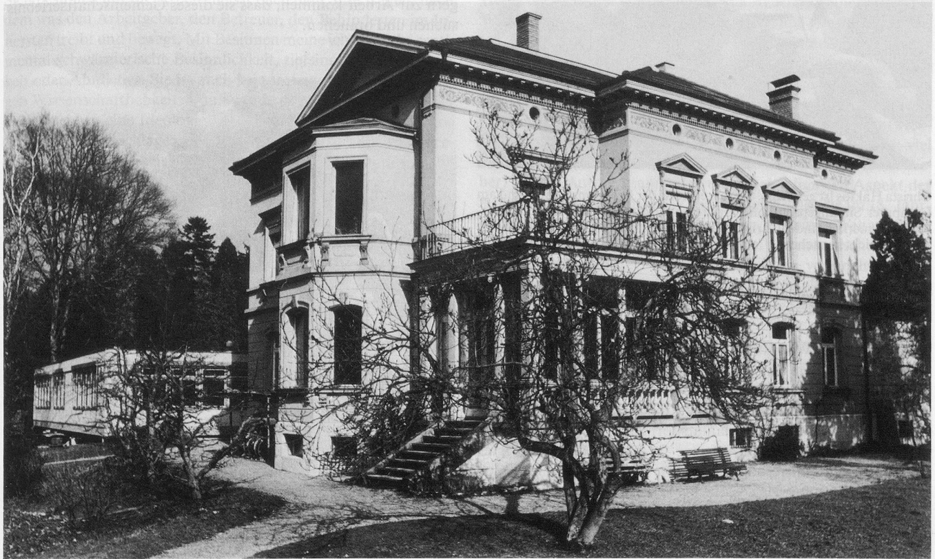
Geistiges Zentrum der Eingliederungsstätte ist das Anna-Stockar-Heim. Hier wurden vor 25 Jahren die ersten Arbeitsplätze für Behinderte eingerichtet.

Text und Aufnahmen: Max Baumann, «Schaffhauser Nachrichten»