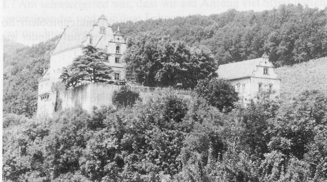
Schulheim Schloss Kasteln, Oberflachs.

Der letzte Samstag im Juni, durch strahlendes Sommerwetter vergoldet, war für das Schulheim Schloss Kasteln im aargauischen Schenkenbergertal ein ganz besonderer: Geladen waren alle Interessierten zu einem Tag der offenen Tür nach einer zehnjährigen innen- und äusseren Umorganisations- und Renovationsphase. Der Einladung folgten Hunderte von Gästen.