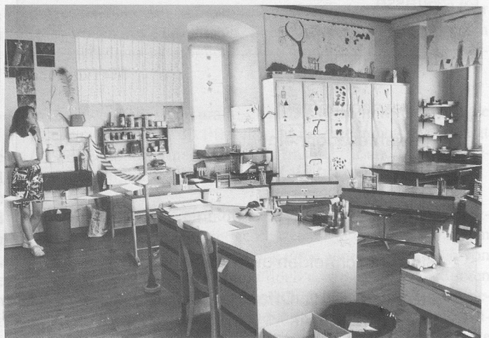
Mädchen und Buben bei der Aufführung von «Schloss Rabenstein». Blick in eines der Klassenzimmer.