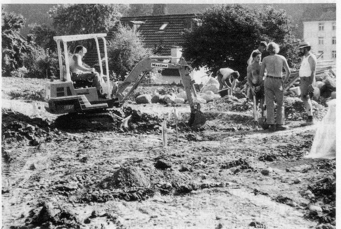
Hände und Maschinen: Zupacken lautet die Devise, ob beim Mischen - oder Graben (hier entsteht die Feuchtzone).