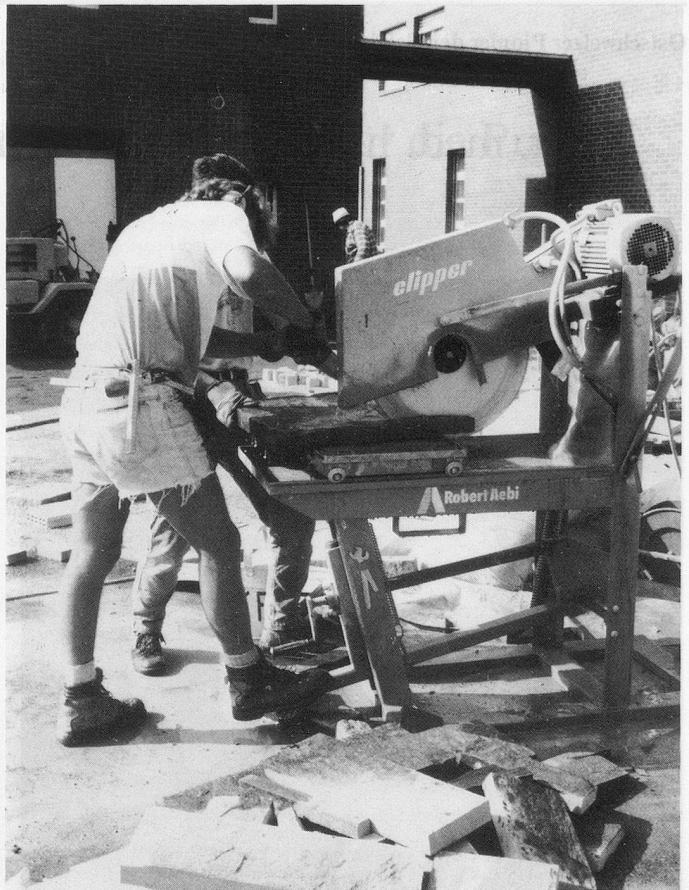
Granitplatten aus dem Maggiatal für die intimeren Höfe im Wohnbereich: Die verschiedenartig strukturierten Bodenbeläge helfen bei der Orientierung; während der Lagerwoche können die Lehrlinge auch eher ungewohnte Arbeiten erledigen.

Während der Lagerwoche beschäftigten sich die 46 jungen Leute mit: