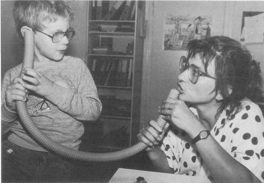
In den Therapien bauen die im Verein Ostschweizer Logopäden zusammengeschlossenen Fachkräfte te spielerisch und doch gezielt Störungen der Sprache ab.

Die Sprache ist das wichtigste menschliche Kommunikationsmittel. Entsprechende Störungen werden auch in der Ostschweiz durch sorgfältig ausgebildete Sprachheillehrer abgebaut. Kinder und Jugendliche mit schweren Sprachbehinderungen besuchen die, ein Internat umfassende Sprachheilschule St. Gallen, in der ebenfalls zahlreiche Logopädinnen und Logopäden erfolgreich tätig sind.