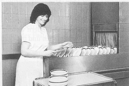
Glänzendes Ergebnis beim Geschirr: Sumazon und Sumabrite.