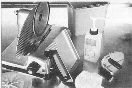
Sumanet, Sumabac, Sumarein: Alles für hygienisch-saubere Küchenmaschinen.