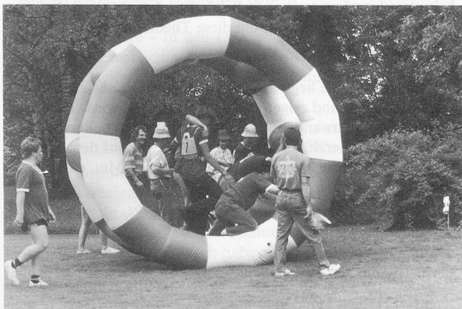
Spass im Riesenrad;