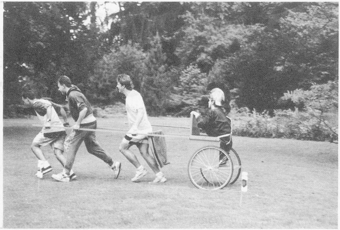
. . . die Fahrt mit dem Römerwägel.