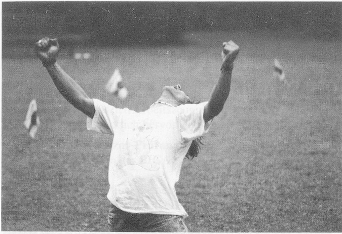
Siegerpose . . .