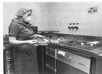
Miele Thermodesinfektor in der Chirurgie.

W er einmal auf einer Intensivstation war, weiss wie aufwendig die Pflege von Intensivpatienten ist. Denn nach einer Operation ist der Patient oft nicht gleich wieder auf den Beinen. Zur aufopfernden Pflege gehört im Spital eine umfassende Infrastruktur, ohne die die Arbeit der Ärzte und Pfleger nicht möglich wäre: sauber sterilisierte Operationsbestecke, desinfizierte Beatmungsgeräte, Tubusse usw.