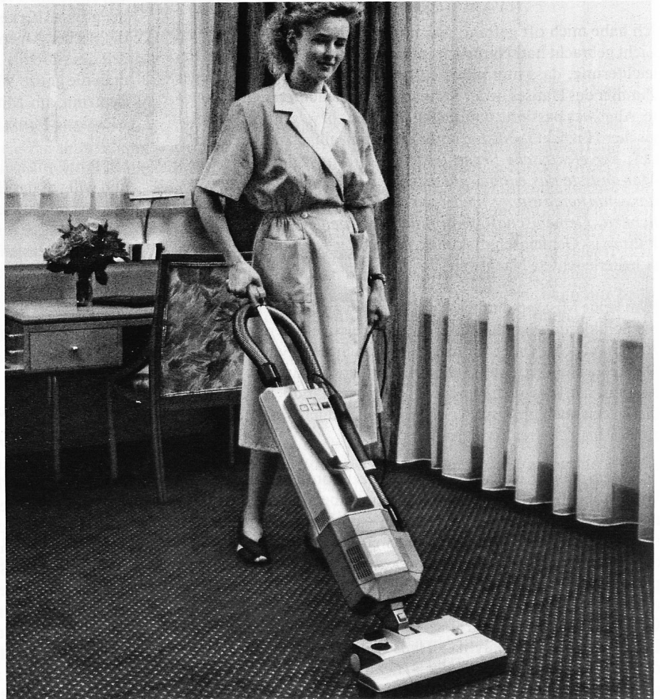
Ein elektronisches Kontrollsystem schützt zuverlässig Teppich und Bürstenmotor.

Ein Schrägstellen der Führungsstange genügt - und der Bürstenmotor setzt kraftvoll ein. Dann saugt er kompromisslos Teppiche, Böden und Möbel bis zum letzten Stäubchen sauber. Und weil sich seine rotierende Walzenbürste stufenlos der Art des Teppichs und der Florhöhe anpassen lässt, bringt er auf jeder Oberfläche seine volle Leistung. Auch an schwerzugänglichen Stellen: Sein nur 8 cm hoher Saugfuss gelangt auf seinen vier Rollen problemlos unter Möbel und Heizkörper. Das integrierte Handabsaugsystem erreicht auch jenen Schmutz, der sich in Nischen und Spalten versteckt. Dabei verhindert eine separate Luftkühlung auch bei intensivem Einsatz eine Überhitzung des Getriebes. Und da durch Trennen von Saug- und Kühlluft keine Staubpartikel in den Motor eindringen, hat dieser eine hohe Lebensdauer. Gute Gründe, Ihre Partner von Lever Sutter einmal anzurufen. Sie beraten Sie gerne.