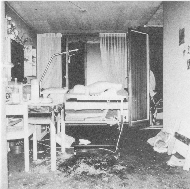
Das muss nicht sein!

Flammen. Das geht oft schneller, als sich's liest, nicht selten nahezu explosionsartig. Nach nur 7 bis 10 Sekunden flackert bloss noch schwach das nackte Baumgerippe, wenn nicht in der Zwischenzeit einige Haushaltgegenstände wie Gardinen, Postermöbel oder Teppiche in Brand geraten sind. Wer nach Wasser oder einer löschenden Decke eilt, kommt dann leicht zu spät. Der Abbrand geht mit der Entwicklung eines kräftigen Überdruckes vor sich. Dabei entsteht eine gewaltige Druckwelle, welche selbst doppelt verglaste Fenster zu sprengen und Türen aus dem Rahmen zu schleudern vermag. Bei einer «Christbaum-Explosion» in Zürich war die Druckwelle so wuchtig, dass sie, nachdem sie die Türe zum angrenzenden Zimmer aus der Füllung gesprengt hatte, fast die ganze doppelwandige Trennmauer zur Nachbarwohnung zum Einsturz brachte. Das anwesende Ehepaar überstand die Explosion relativ unbeschadet, erlitt dann aber bei den Lösversuchen ziemliche Verbrennungen, was die Überführung ins Waidspital nötig machte.