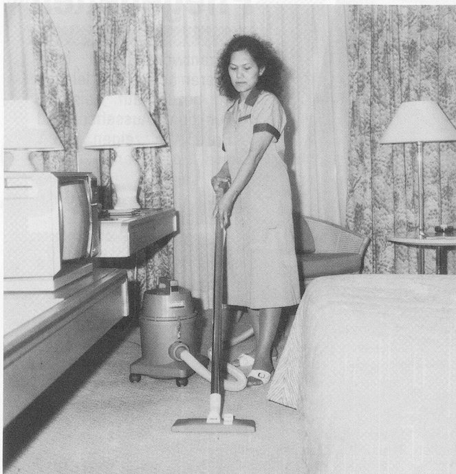
WetrokBantam 6 – ein leichter, leistungsstarker Gewerbestaubsauger

Der kleine Wetrok-Bantam 6 garantiert auf Teppich- und Hartbodenbelägen Leistungen wie ein Grosser.