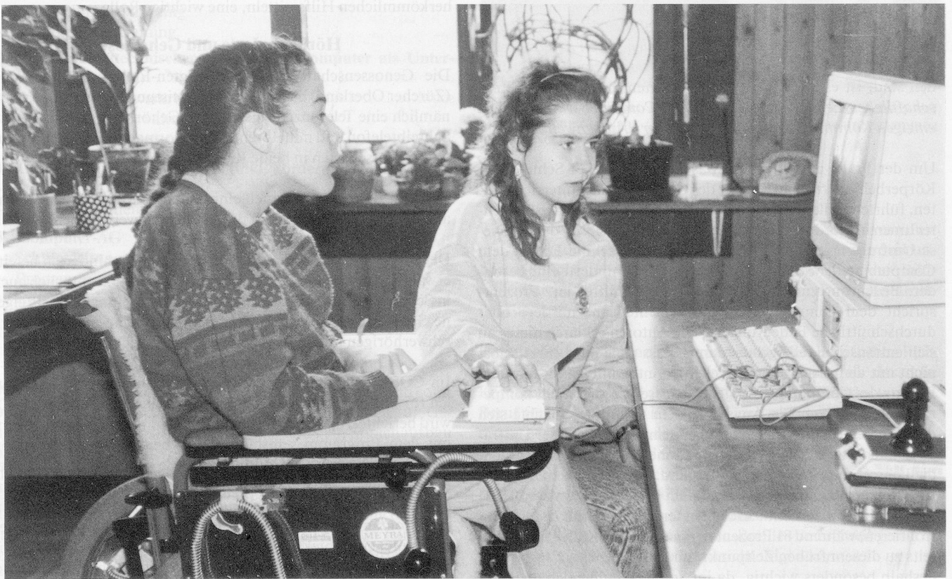
Lernen mit Hilfe der Technik: Behinderte Schülerinnen lösen Geometrieaufgaben.

Nachdem ab Mitte der 80er Jahre von Pädagogen festgestellt wurde, dass der Computer im Schulunterricht, besonders im Bereich von Mathematik, Lesen und Schreiben, eine Lernsteigerung erbrachte, fand er auch Einzug in den Sonderschulen. Obwohl insbesondere in der Deutschschweiz der Computer bisher nicht nur eine schulische Leistungssteigerung zum Ziele hat, sondern viel eher versucht wird, ihn in den Schulalltag und damit den späteren Lebensalltag zu integrieren (Erstellen von Briefen, Einladungen, Zeitungen, Grafittis usw.), wird er seit kurzem auch zu rein schulischen Zwecken genutzt. Auch in Sonderschulen soll der CUU (= Computerunterstützter Unterricht) den Schülern die modernen Informationstechnologien ganzheitlich nahebringen. In diesem Artikel soll der Frage nachgegangen werden, ob und wie der Computer verschiedenen Behindertengruppen hilft, schulische und berufliche Leistungen zu erhöhen und damit zu mehr gesellschaftlicher Integration zu verhelfen. Nach einer Untersuchung, die im Rahmen der Problemstellung «Informatik und Computernutzung im schweizerischen Bildungswesen» erhoben wurde (ETH Zürich), zeigte sich, dass 22 Prozent der Sonderschulen den Computer im Unterricht bereits einsetzen. Laut Professor Frey von der ETH Zürich hat der Computer im Sonderschulbereich vermutlich seinen grössten Nutzen.